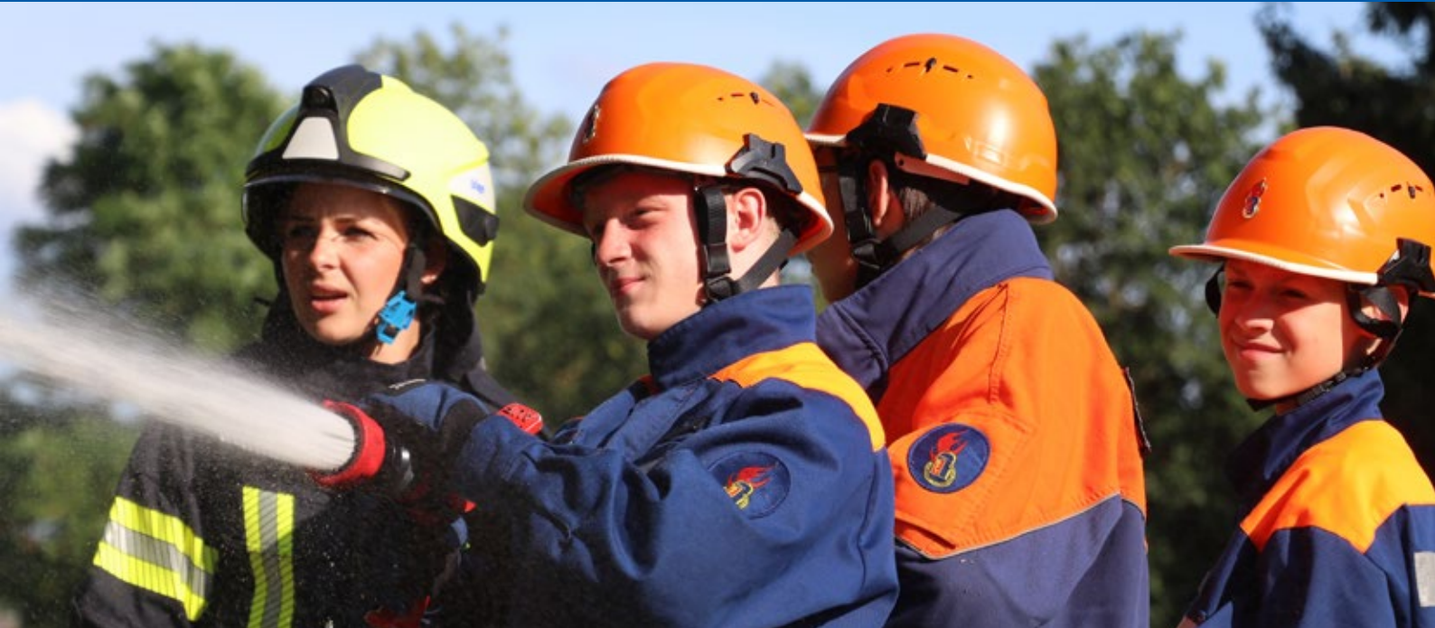
Löschübung beim Jugendfeuerwehr-Dienst

Zusammenspiel unterschiedlicher Talente und somit die Möglichkeit, jedes Mitglied teilhaben zu lassen. Neben Wettbewerben gibt es auch Leistungsnachweise, die den Lernerfolg der Jugendfeuerwehr-Mitglieder unter Beweis stellen.