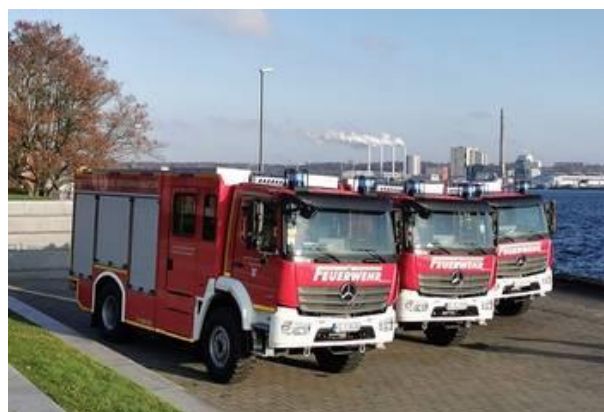
LFV: Im März 2020 soll ein Ortstermin mit Vorführung stattfinden.

Aktuell gibt es in Schleswig-Holstein 1.342 Freiwillige Feuerwehren mit rund 49.000 Mitgliedern. Der Großteil von ihnen engagiert sich ehrenamtlich. Die vier Berufsfeuerwehren der Städte Flensburg, Kiel, Lübeck und Neumünster stellen aktuell etwa 900 Beamte.