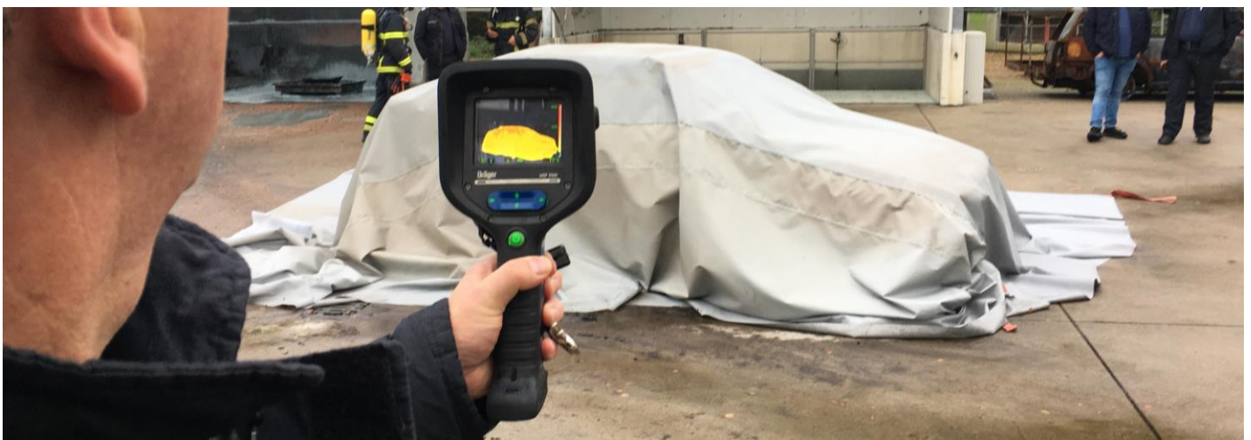
Einsatz einer Löschdecke im Brandfall

>> Einladung: https://nextcloud.kfv-herzogtum-lauenburg.de/446/index.php/s/z9cCqGR36HaxGAo