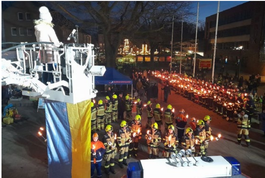
Auf dem Pinneberger Rathausplatz wurden die Fahrzeuge für die Ukraine übergeben.

„Retter helfen Rettern“, die Benefizaktion der Feuerwehren Geesthacht und Pinneberg hat eine erfolgreiche Spendensammlung hinter sich. Nachdem sich die Wehrführer der beiden Feuerwehren bei einem Treffen ausgetauscht hatten, war die Idee geboren, ein ausgemustertes Fahrzeug der FF Geesthacht über einen Spendenaufruf mit notwendiger Beladung auszustatten. Das Fahrzeug sollte anschließend voll einsatzbereit den Feuerwehreinsatzkräften in der Ukraine zur Verfügung gestellt werden. Auf diese Idee folgte eine große Welle der Solidarität aus allen Ecken des Landes.