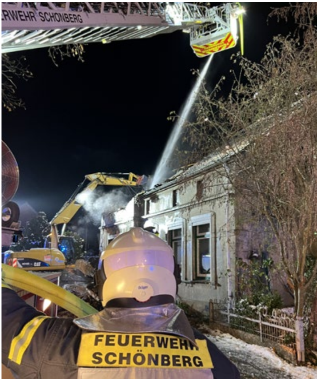
Ein Todesopfer war bei diesem Brand in Schönberg zu beklagen.

Am Sonntag (18.12.) kam es in frühen Nachmittagsstunden zu einem Feuer in einem Einfamilienhaus in Schönberg. Gegen 14:40 Uhr wurden die Einsatzkräfte mit dem Stichwort FEU, Feuer, Standard, alarmiert.