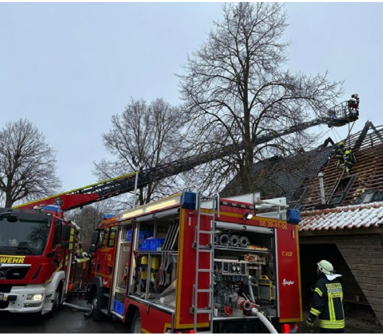
Tragischer Einsatz in Wulfsfelde mit zwei Todesopfern.

In der Nacht von Freitag auf Samstag (10.12.) gegen 04:07 Uhr gingen in den beiden Rettungsleitstellen in Elmshorn (Kooperative Regionalleitstelle West) und Bad Oldesloe (Integrierte Rettungsleitstelle Süd) gleich mehrere Notrufe über einen Gebäudebrand in der Gemeinde Pronstorf/ Ortsteil Wulfsfelde ein. Bei den eingehenden Notrufen wurde bereits mitgeteilt, dass sich noch Personen im Gebäude befinden.