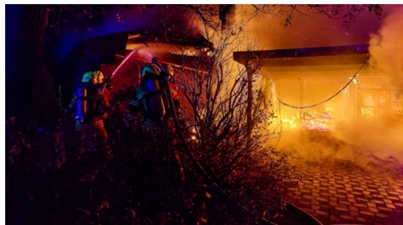
Das Feuer in diesem Carport in Lentförden griff auch auf ein Wohnhaus über.

Eingesetzte Wehren: FF 'n Lentförden, Bad Bramstedt, Alveslohe,