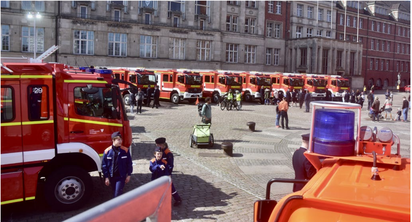
12 neue HLF 10 konnten die Freiwilligen Feuerwehren der Landeshauptstadt Kiel in Dienst stellen.

Der Brandschutz in der Landeshauptstadt hat einen großen Sprung gemacht. Erstmals in der Geschichte des Stadtfeuerwehrverbandes Kiel wurden mit einem Schlag zwölf identische Fahrzeuge des Typs HLF10 angeschafft. Bei einem Fest am Sonnabend wurden die neuen Löschfahrzeuge auf dem Rathausplatz präsentiert. Das Blasorchester der Feuerwehr Molfsee sorgte mit Manfred Peter für die passende Musik.