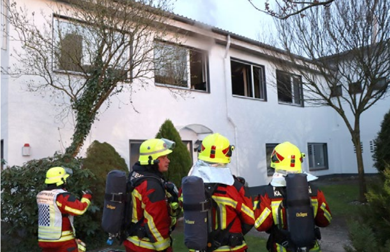
Ein brennender Kühlschrank in einem Bürogebäude in Kaltenkirchen forderte die Feuerwehr.