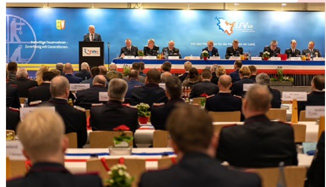
Die diesjährige Landesfeuerwehrversammlung fand in den Holstenhallen in Neumünster statt.

Die positiven Zahlen dürfen aber nicht darüber hinwegtäuschen, dass im Werben um Nachwuchs nicht nachgelassen werden darf. Denn es gebe durchaus Feuerwehren, die unter einem massiven Mangel an verfügbaren Einsatzkräften leiden. Kampagnen und Aktionen gab und gibt es daher zuhauf. Ein Beispiel konnten die Delegierten vor der Holstenhalle in Augenschein nehmen: Ein sogenanntes Infomobil, das für vielfältige öffentlichkeitswirksame Veranstaltungen von jeder Feuerwehr im Lande genutzt werden kann, wurde dort ausgestellt. Eine runde Viertelmillion Euro hat das Innenministerium Schleswig-Holstein sich diese besondere Nachwuchswerbung kosten lassen.