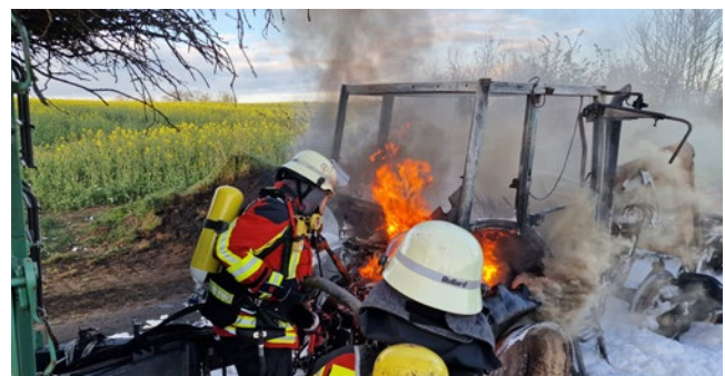
Ein Feuer beendete die Fahrt eines Traktors bei Haßmoor..