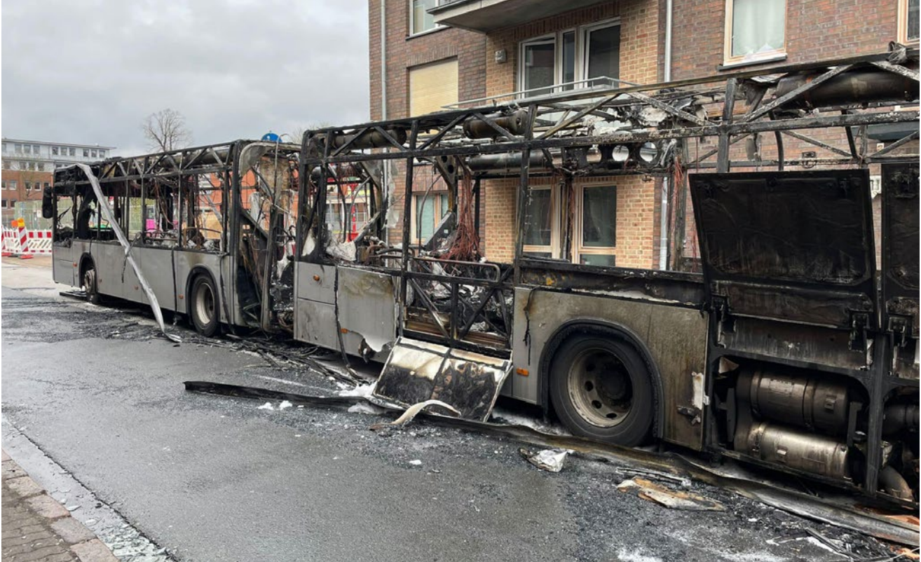
Ein brennender Gelenkbus in Pinneberg löste einen Großseinsatz aus.

Ein Gelenkbus geriet am 12. April in der Schauenburger Straße in Pinneberg in Brand. Das Feuer beschädigte zwei Wohngebäude, mehrere Personen mussten medizinisch versorgt werden - Feuerwehr und Rettungsdienst waren mit einem größeren Aufgebot vor Ort.