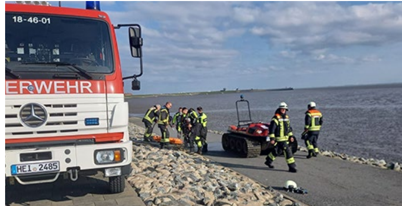
Im Watt vor Büsum befreite die Feuerwehr Mutter und Tochter.