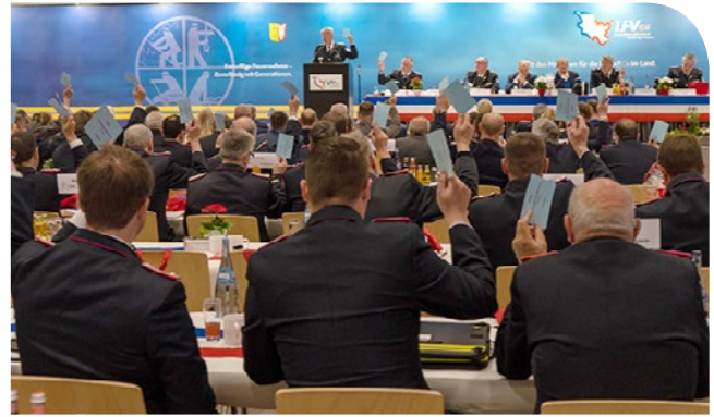
Bei Abstimmungen waren sich die Kameradinnen und Kameraden meist einig.