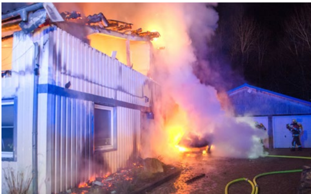
In der Büsumer Strasse in Rendsburg brannte ein Gewerbeobjekt.

In der Nacht zu Freitag (28.4.) brannte gegen 2:00 Uhr aus bisher unbekannter Ursache eine Lagerhalle in der Büsumer Straße in Rendsburg. Beim Eintreffen der Feuerwehr stand der vordere Hallenbereich bereits in Vollbrand.