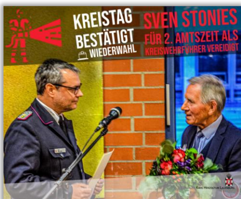
Kreis Herzogtum Lauenburg, Facebook

Elmenhorst – Nicht vollständig, aber einige interessante Artikel aus den Medien sowie sozialen Netzwerken über die Feuerwehren bzw. KFV haben wir hier veröffentlicht. Siehe unter www.kfv-herzogtum-lauenburg.de/pressespiegel