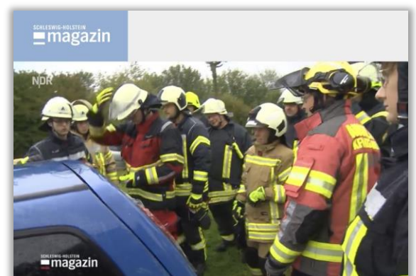
Norddeutscher Rundfunk (NDR) SH Magazin