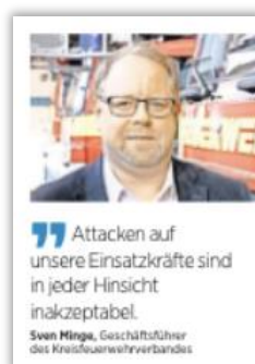
Lübecker Nachrichten (LN)