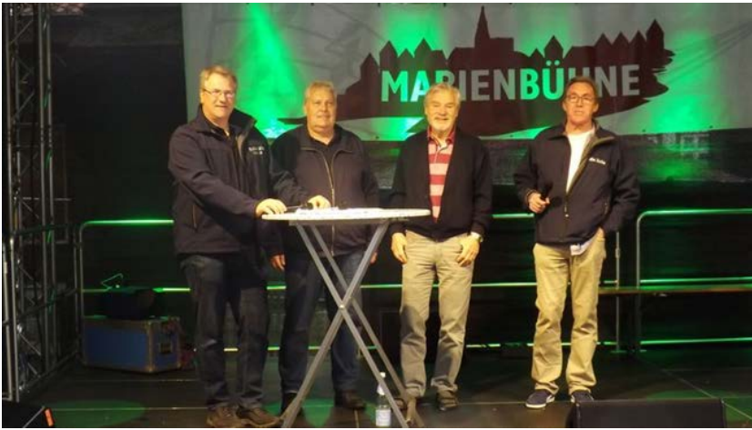
Foto: v.l. Claus Lühr, Friedhelm Schneider, Hartmut Großmann und Klaus Becker

Stadtfestbühne Winsen/ Luhe: Moderation: Leonie Laryea und Wolfgang Laudan